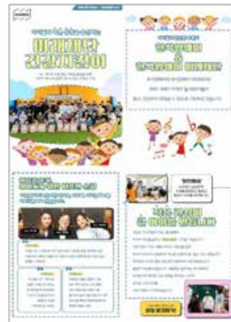
6. 한국암웨이 아마그림 내 한국암웨이 미래재단 사업 홍보