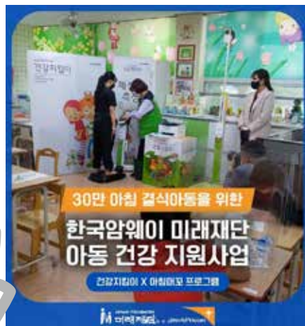
5. 한국암웨이 미래재단 인스타그램 사업 홍보