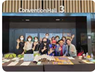
1. 전국 18개 도시, 21회 행사 / 모금 및 홍보활동 전개(1~12월)