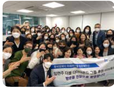
4. 정기후원자, 한국암웨이 미래재단 방문