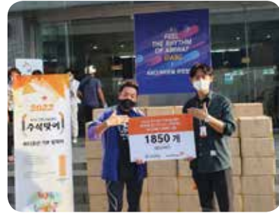
2. 전국 ABC '추석 나눔 현물 기부행사' 진행 / 연말 사랑의 치약, 칫솔 모으기 행사