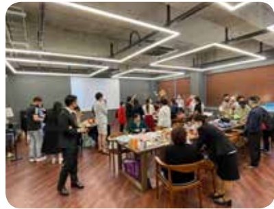
3. ABO와 함께 하는 후원 바자회(수원, 영월)